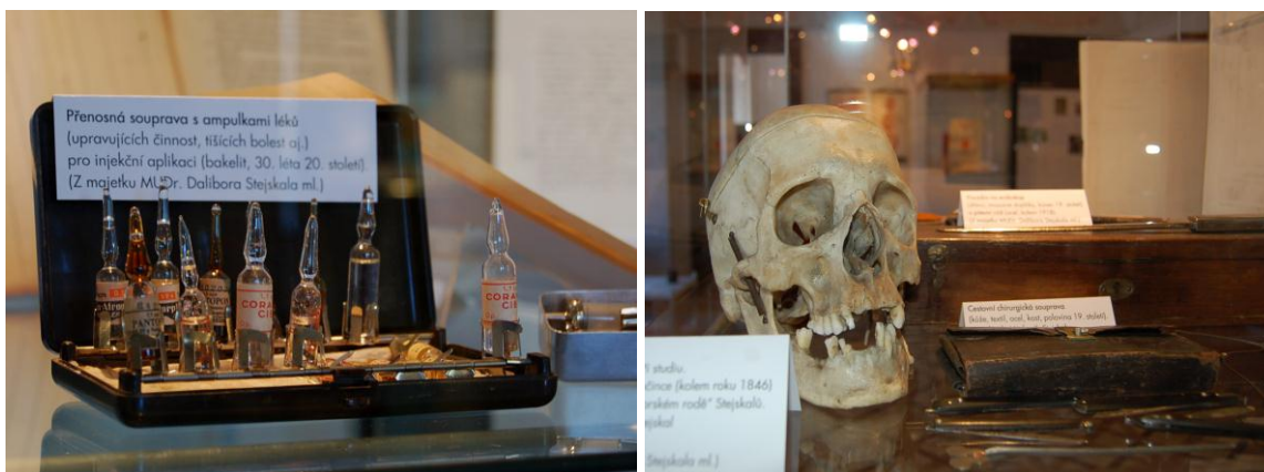
Obr. 3,4 Ukázky z instalace výstavy Zdravičko pane doktore ve vlašimském zámku.

Krátkodobých výstav uspořádalo v roce 2011 Muzeum Podblanicka celkem 16 (viz Příloha č. 1). Z hlediska návštěvnosti byla nejatraktivnější výstava Zdravičko pane doktore , která byla instalována v letních měsících ve vlašimském zámku a seznamovala návštěvníky s dějinami lékařské péče na Podblanicku do roku 1945. Současně s touto výstavou byla ve vlašimském zámku instalována také další krátkodobá výstava s názvem 140 let železnice na Podblanicku , která se také těšila mimořádnému zájmu návštěvníků. Z dalších výstav pořádaných ve Vlašimi lze namátkou připomenout velice atraktivní vánoční výstavu Betlémy skleněné a jiné , v jejímž rámci byla prezentována sklářská tvorba, která má v českých zemích bohatou tradici. Součástí této výstavy byly také ukázky práce se sklem, které se těšily nadšenému zájmu všech návštěvníků. V benešovské pobočce muzea se s největším ohlasem setkala vánoční výstava Vánoce v muzeu – betlémy a také další výstava věnovaná historickým panenkám, kterou pořádalo muzeum ve spolupráci s Klubem panenek.