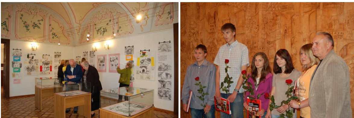
Obr. 7,8 Vernisáže Fotografie z vernisáží muzejních výstav, konkrétně výstavy Motivy (středo)českého venkova ak. mal. L. Hojného a výstavy prací výtvarného oboru ZUŠ ve Vlašimi.