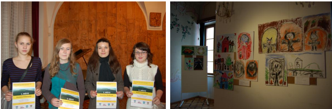
Obr. 13,14 Záběry ze slavnostního vyhlášení výsledků soutěže Malujeme s muzeem a z instalace prací, které byly do soutěže přihlášeny.

Pravidelně jsou mezi kulturně výchovnými akcemi muzea zastoupeny přednášky a edukační programy. V roce 2011 jich muzeum uspořádalo celkem 26 (viz Příloha č. 2).