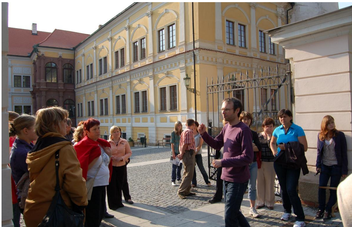
Obr. 12 Součástí VII. zámecké muzejní noci byla i komentovaná prohlídka vlašimského zámeckého parku.

Jako každoročně se Muzeum Podblanicka zapojilo také do pořádání nejrůznějších akcí nadregionálního a mezinárodního charakteru, jako jsou Mezinárodní den památek, Festival muzejních nocí, Dny evropského kulturního dědictví či Den Středočeského kraje. V rámci těchto akcí připravilo pro své návštěvníky celou řadu doprovodných akcí.