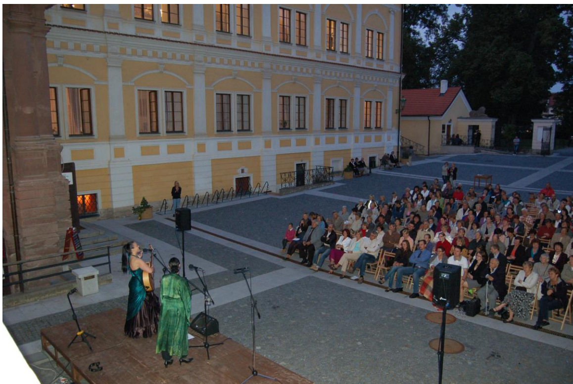
Obr. 9 Koncert Two voices na nádvoří vlašimského zámku během VII. muzejní noci (foto V. Hanusová).

V rámci kulturně výchovné činnosti uspořádalo muzeum v roce 2011 celkem 84 akcí. Největší zájem veřejnosti se, jako již tradičně, soustředil na koncerty, které se konaly v rámci pravidelné koncertní sezony Muzea Podblanicka ve vlašimském zámku. V roce 2011 jich bylo celkem 12. Dále se muzeum spolupodílelo na pořádání dalších 14 koncertů. V rámci muzejní koncertní sezony vystoupila celá řada vynikajících a známých ale i mladých a začínajících umělců (např. Edita Randová, manželé Kasíkovi, Jakub Pustina, atd.) a hudebních těles (např. Pražský žesťový soubor, Two voices, Janáčkovo trio, Ensemble Martinů, atd.).