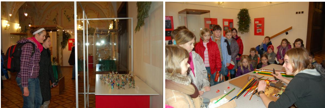
Obr. 5,6 Výstava Betlémy skleněné a jiné s ukázkou výroby skleněných figurek.