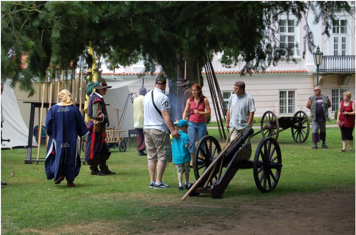
Obr. 10,11 Záběry z průběhu Vostroveckého slavení ve vlašimském zámku.