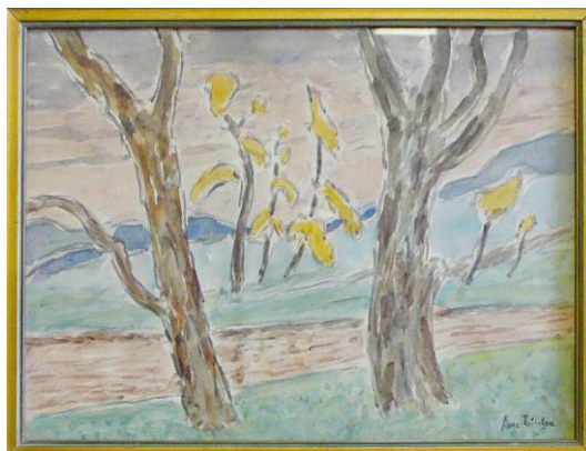
Obr. 1,2 Obrazy A. Roškotové zakoupené do sbírek Muzea Podblanicka v roce 2011.

Také v roce 2011 byla nedílnou součástí muzejní práce péče o sbírkový fond muzea. Ve sledovaném roce bylo při přípravě muzejních výstav a úprav muzejních expozic odborně konzervováno 57 sbírkových předmětů, u kterých si to vyžadoval jejich stav. Bohužel z důvodu omezených finančních prostředků muzea nebylo ve sledovaném období přikročeno k žádnému restaurování sbírkových předmětů, což by ale měl být výjimečný a přechodný stav.