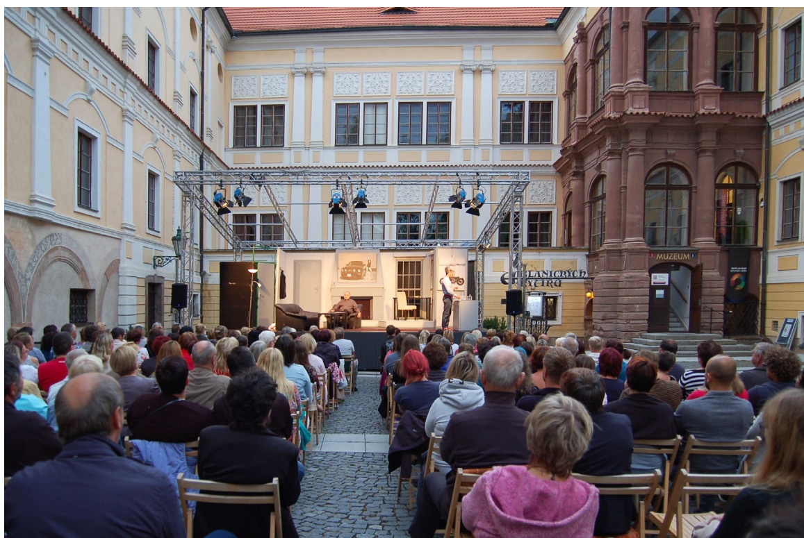
Obr. 9 Divadelní představení Smím prosit? na nádvoří vlašimského zámku