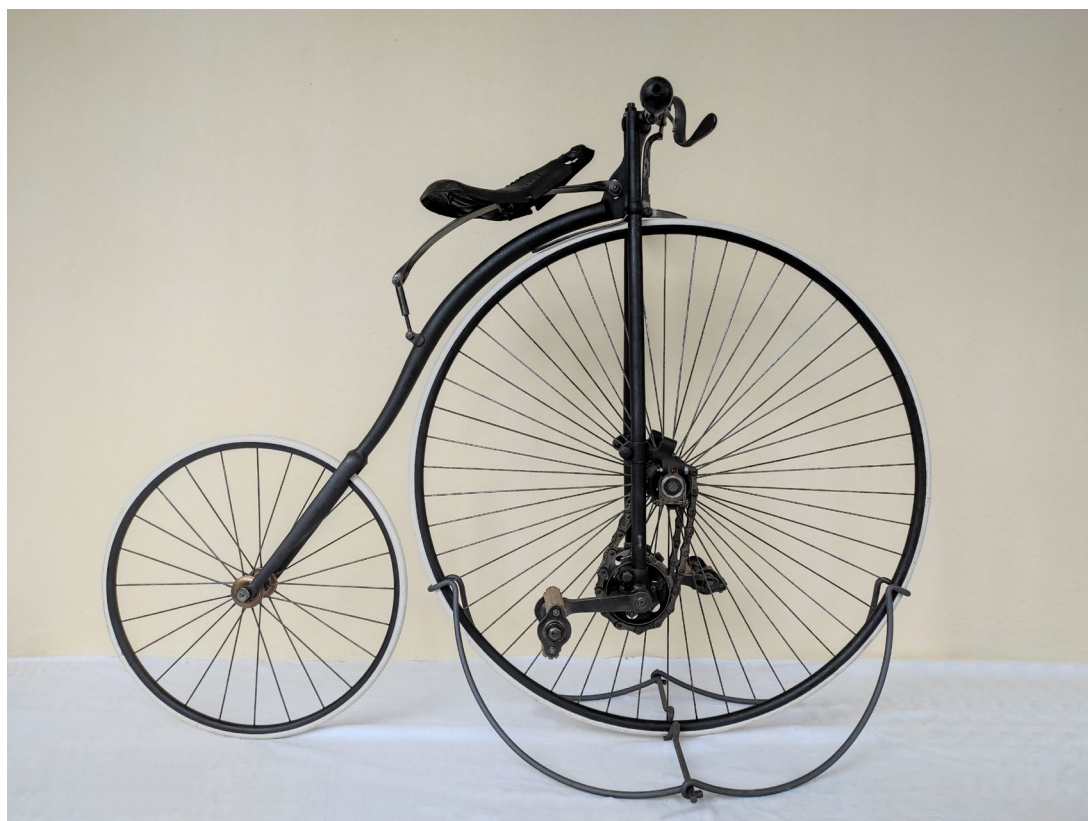
Obr. 2 Zrestaurované jízdní kolo firmy Hillman Herbert & Cooper (invc. 3355)

Knihovna, fotoarchiv muzea a jednotliví odborní muzejní pracovníci ve sledovaném roce vykázali celkem 39 badatelských návštěv.