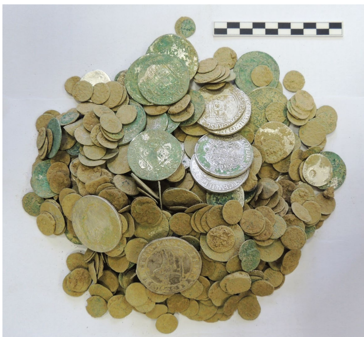
Obr. 1 Mincovní depot z Maršovic krátce po nálezů

Nejvýznamnějším přírůstkem do sbírkového fondu muzea byl v roce 2020 bezpochyby depot obsahující více jak 700 kusů mincí vyražených na přelomu 16. a 17. století a torzo keramické nádoby, v níž byl uložen, který byl nalezen u obce Maršovice na Benešovsku. V depotu je dle prvotních odhadů zastoupeno široké spektrum mincí od tolarových ražeb různé provenience (Německo – Hamburg, Norimberk, Lüneburg, Švýcarsko – St. Gallen, Schaffhauseng, Nizozemí, Španělské Nizozemí a další) až po drobné grošové ražby z doby vlády Rudolfa II. a Matyáše II., jež v počtu více jak 600 kusů tvoří podstatnou část depotu. Ihned po nálezů byla zahájena jeho nákladná konzervace, podrobné zdokumentování depotu proběhne v roce 2021.