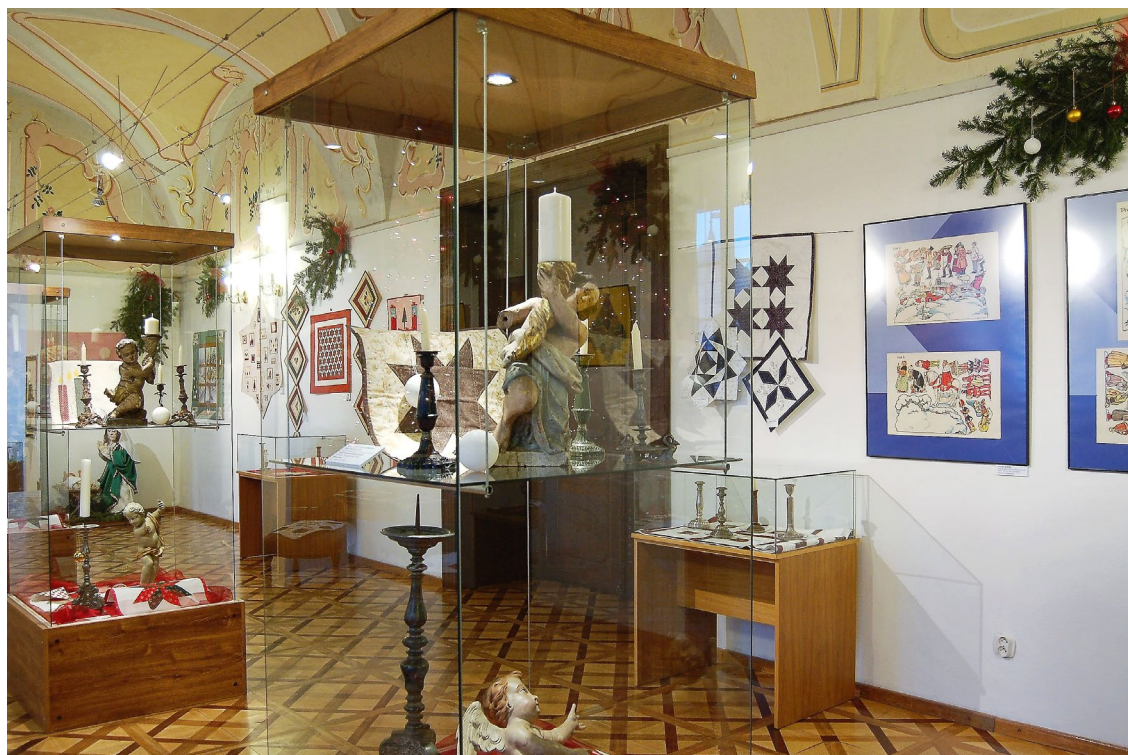
Obr. 7 Výstava Vánoce s patchworkem v zámku ve Vlašimi