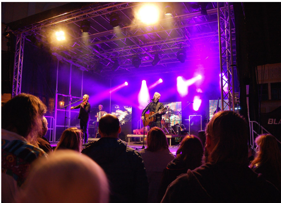
Obr. 10 Koncert skupiny Čechomor na nádvoří vlašimského zámku