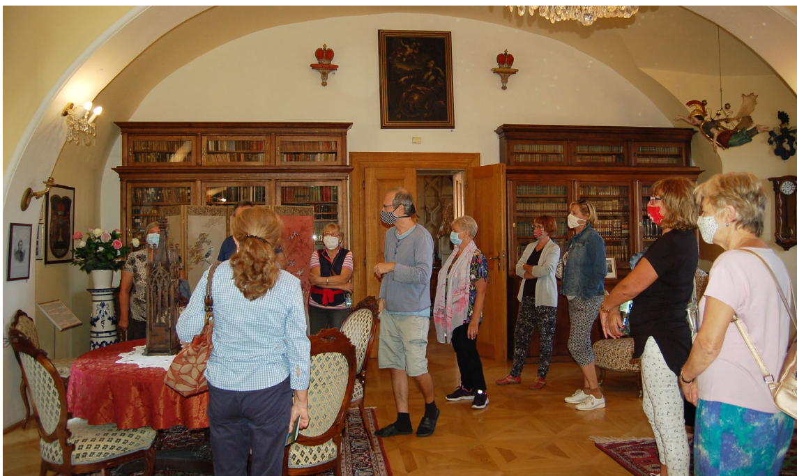
Obr. 11 Komentovaná prohlídka expozic ve vlašimském zámku rámci Dnů evropského kulturního dědictví