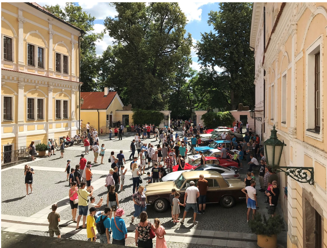
Obr. 12 Výstava vozů Rolls-Royce, Bentley, Ferrari a dalších historických vozidel