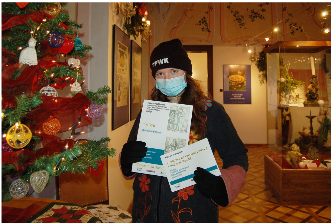
Obr. 13 Vítězka jedné z kategorií výtvarné soutěže Malujeme s muzeem

Také v roce 2020 Muzeum Podblanicka, p. o., zaštitilo činnost Vlastivědného klubu P. A. N. Vlasáka, se kterým muzeum velmi úzce spolupracuje již řadu let.