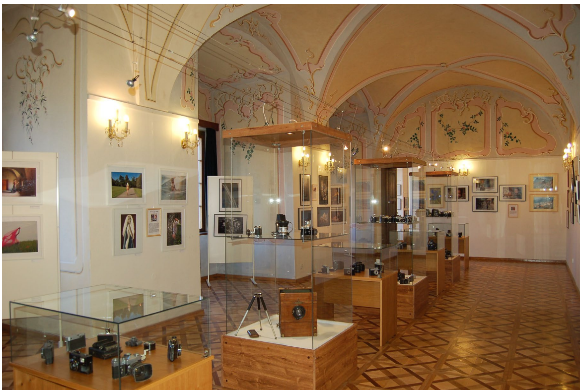
Obr. 3 Instalace výstavy Svět kolem nás v okamžiku času – Fotoklub CoverArt ve vlašimském zámku

muzeum ve spolupráci s agenturou Croce a městem Vlašim velmi kvalitní alternativu – na nádvoří vlašimského zámku vystoupil 14. července 2020 Štefan Margita a jeho hosté . Operní árie v jejich podání si vyslechlo 550 nadšených posluchačů. Dále se muzeum také spolupodílelo na pořádání dalších šesti koncertů ve Vlašimi. Své nezastupitelné místo mají v muzeu také koncerty školní a absolventské koncerty žáků vlašimské ZUŠ. (viz Příloha č. 3)