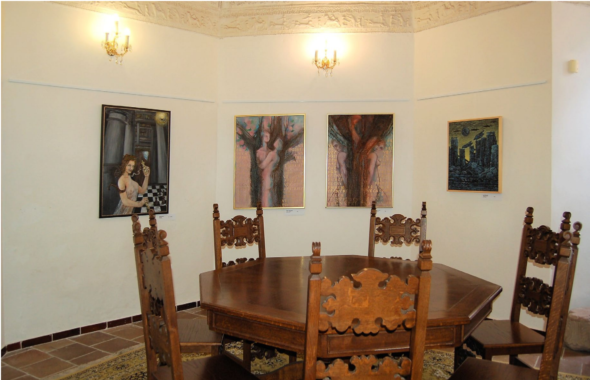
Obr. 4 Instalace výstavy Přestavujeme Spolek pražských výtvarných umělců ve vlášimském zámku