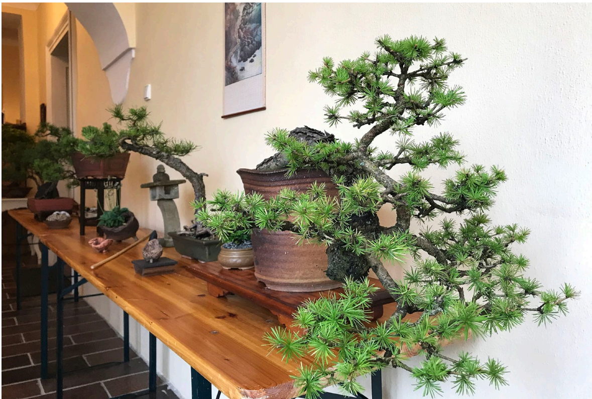
Obr. 5 Výstava bonsají v zámku Růžkovy Lhotice