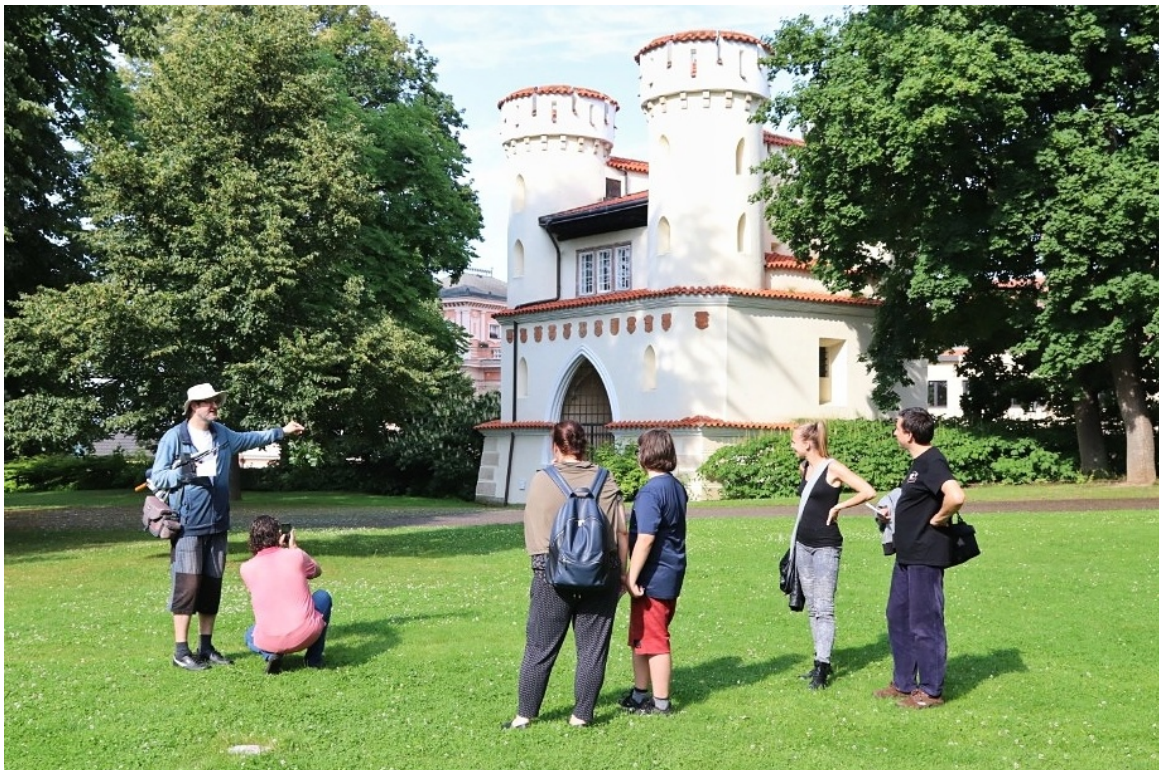
Obr. 15 Fotografický workshop V. Švajcra