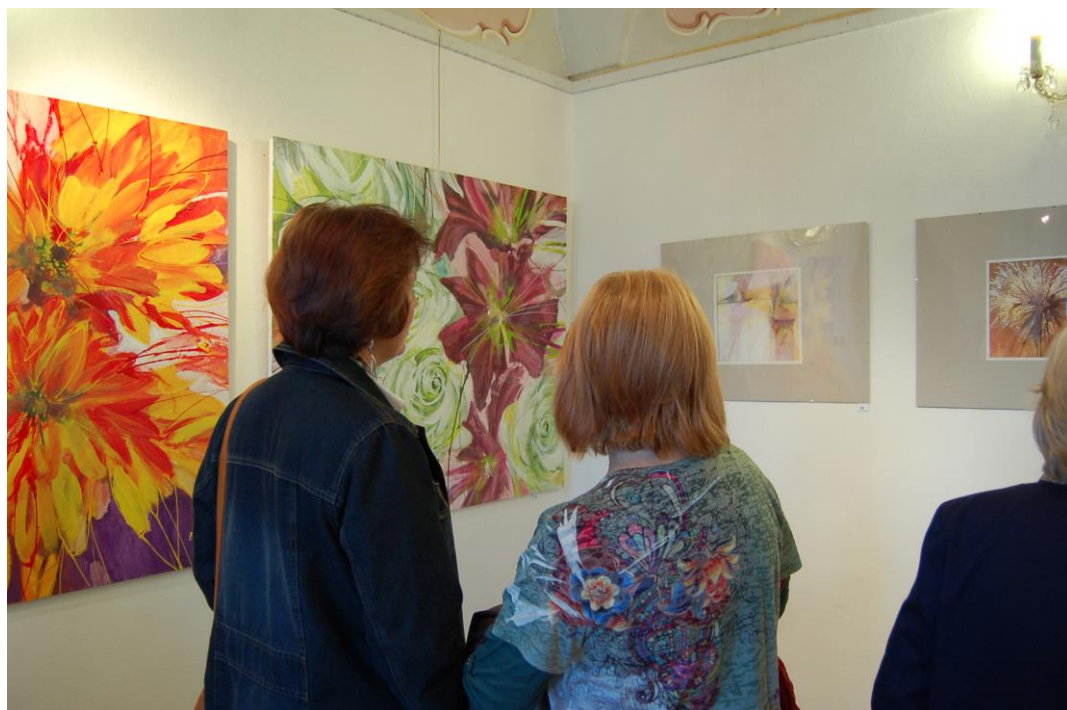
Obr. 11 Instalace výstavy obrazů Josefa Buršíka ve vlašimském zámku