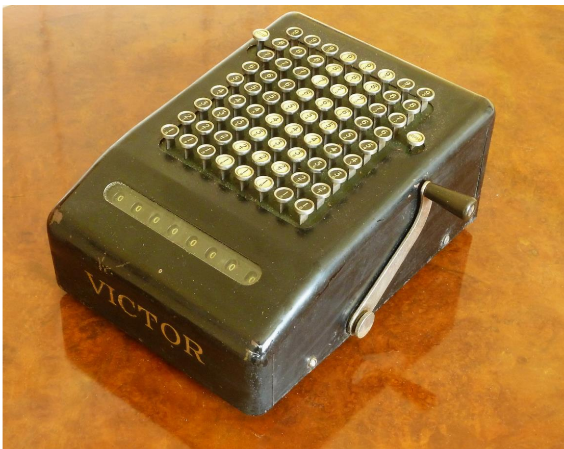
Obr. 2-3 Mezi sbírkovými předměty získanými darem byly například psací stroj Torpedo a mechanický počítací stroj Victor z poloviny 20. století