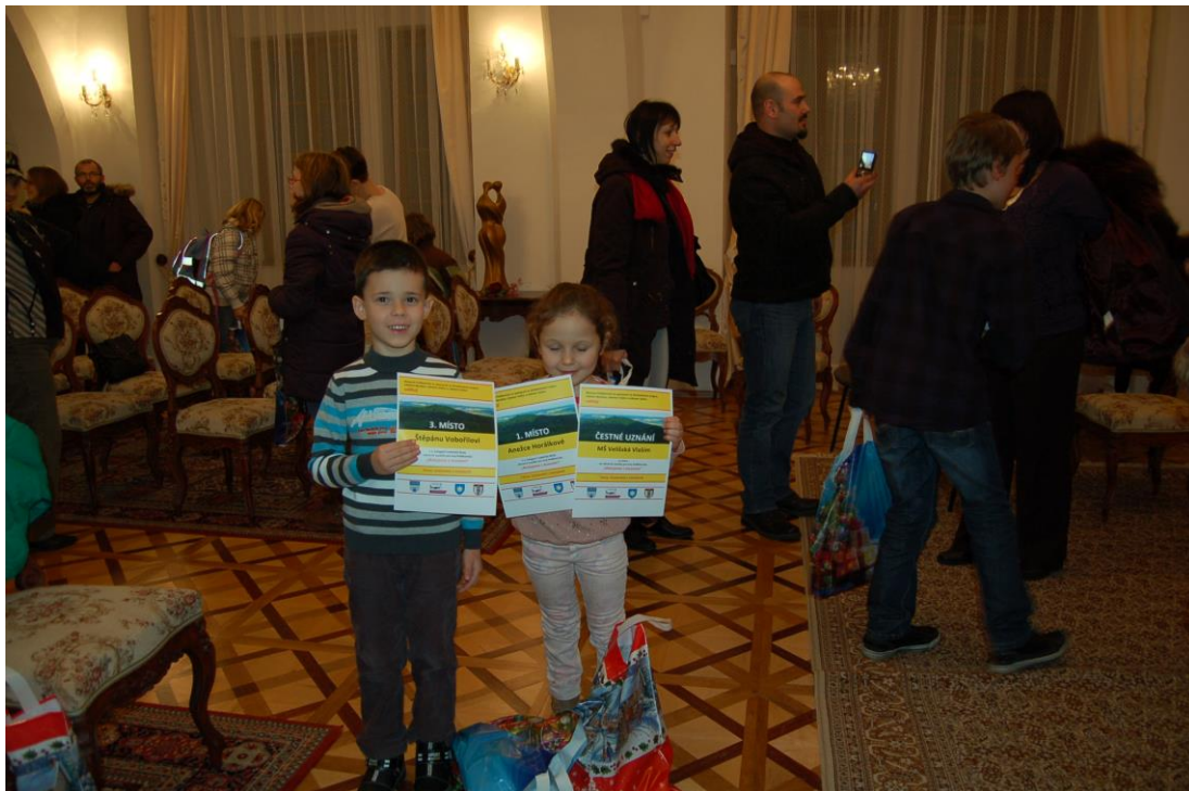
Obr. 16 Slavnostní vyhlášení výsledků soutěže Malujeme s muzeem v obřadní síni vlašimského zámku