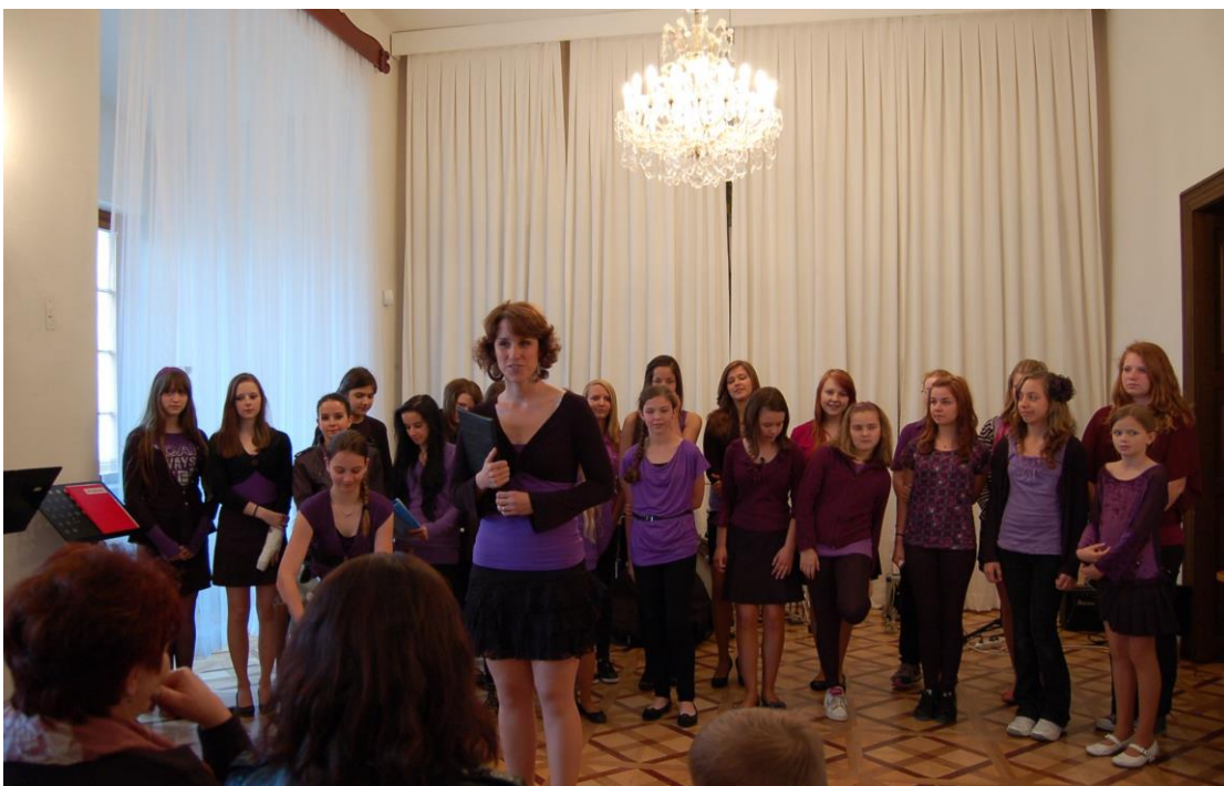
Obr. 15 Koncert ZUŠ Notička Karlov z Benešova ve vlašimském zámku