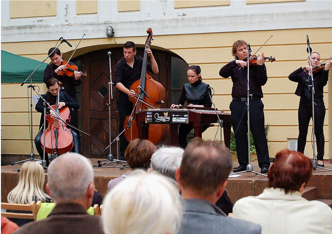
Obr. 14 Koncert souboru Címballica na zámeckém nádvoří v rámci vlašimské Zámecké muzejní noci