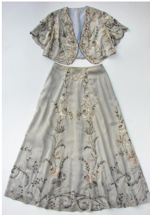
Obr. 4 Šaty z šedé hedvábné látky bohatě zdobené výšivkou s rostlinnými motivy ze sbírek muzea zrestaurované v roce 2013

Knihovna a fotoarchiv muzea ve sledovaném roce vykázaly 114 badatelských návštěv.