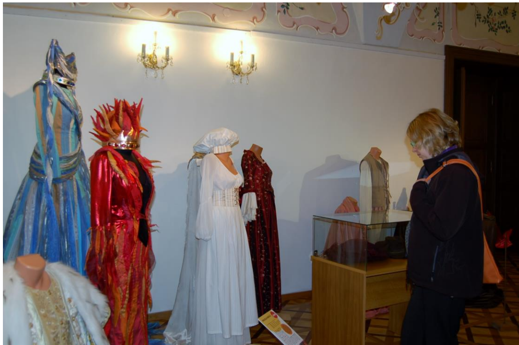
Obr. 10 Ukázky z instalace výstavy Zpátky do pohádky ve vlašimském zámku