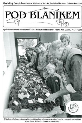
Obr. 19- 20 Obálky 2. čísla 50. ročníku časopisu Sborník vlastivědných prací z Podblanicka a 4. čísla 17. ročníku časopisu Pod Bláníkem