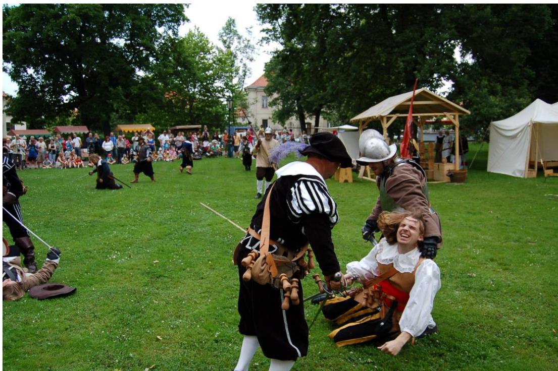
Obr. 13 Záběr z průběhu Vostroveckého slavení ve vlašimském zámku

širším zaměřením. V roce 2013 proběhl již šestý ročník výtvarné soutěže pro děti, žáky a studenty z mateřských, základních a středních škol v regionu, pod názvem „ Malujeme s muzeem “. Tuto soutěž organizovalo Muzeum Podblanicka, p. o., ve spolupráci se Středočeským krajem a městy Benešov, Vlašim a Votice a byla součástí projektu Historický rok na vlašimském zámku. Do soutěže bylo přihlášeno 283 prací dětských výtvarníků ze 14 škol a 12. prosince 2013 byly v obřadní síni vlašimského zámku v rámci slavnostního odpoledne předány věcné ceny autorům vítězných prací. Všechny práce zaslané do soutěže, mezi kterými byla kromě kreseb a maleb zastoupena také keramika, trojrozměrné instalace a dokonce i komiks, pak byly vystaveny ve vlašimském zámku na přelomu ledna a února 2014. Dále v říjnu 2013 pomáhalo muzeum technicky zajistit SOŠ a SOU Vlašim další ročník soutěže O pobár blanických rytířů (viz Příloha č. 5).