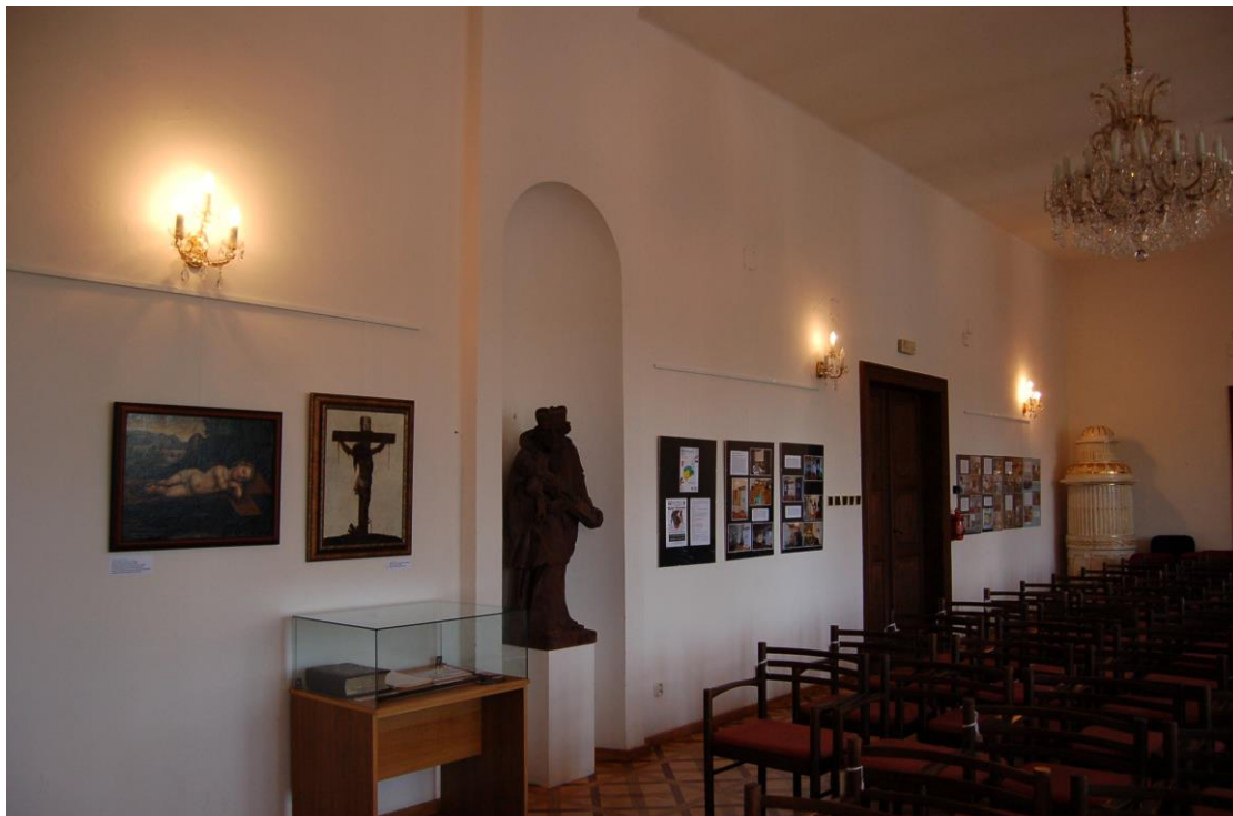
Obr. 18 Akce Muzeotechna byla pro návštěvníky připravena v rámci Mezinárodního dne muzeí ve vlášimském zámku