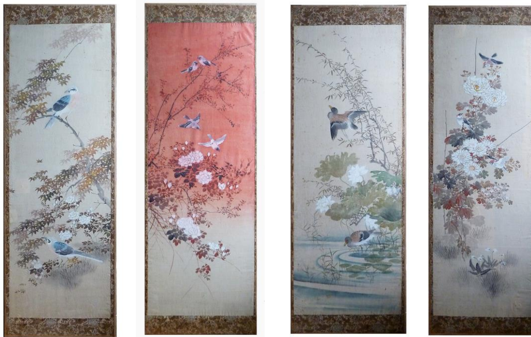
Obr. 6-9 Čtyři díly látkového paravánu s vyobrazením rostlinných a živočišných motivů ve stylu japonerií ze sbírek muzea zrestaurované v roce 2013