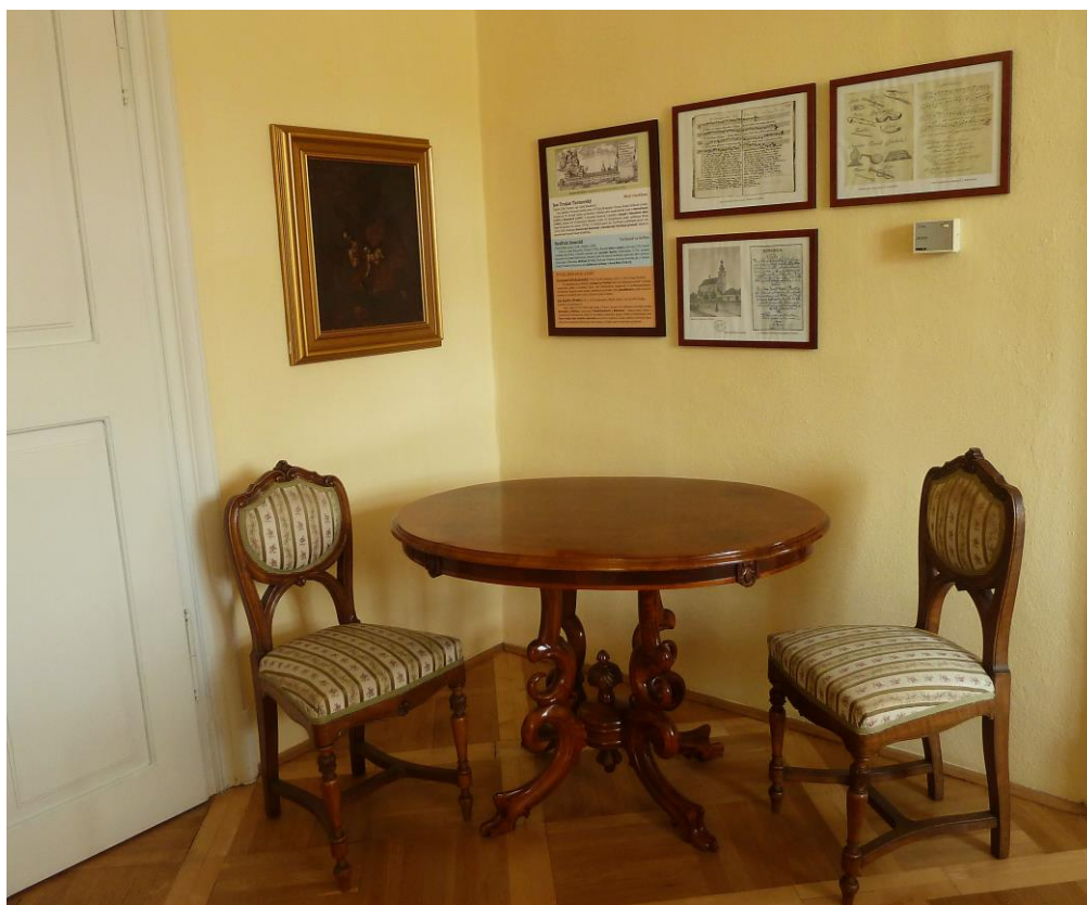
Obr. 1 Stůl z 50. let 19. stol. a židle z 80. let 19. stol. zakoupené do sbírek Muzea Podblanicka, p. o., v roce 2013 instalované v expozici muzea v Růžkových Lhoticích

Rozšíření sbírkového fondu muzea proběhlo prostřednictvím nákupu, zápisu nálezů získaných v rámci záchranné archeologické činnosti a prostřednictvím darů do muzejních sbírek. Z celkového počtu nově získaných přírůstků připadlo 389 položek na dary, které věnovalo muzeu celkem 14 dárců.