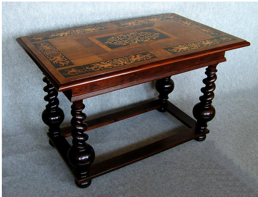
Obr. 5 Dřevěný intarzovaný stůl ze sbírek muzea zrestaurovaný v roce 2013